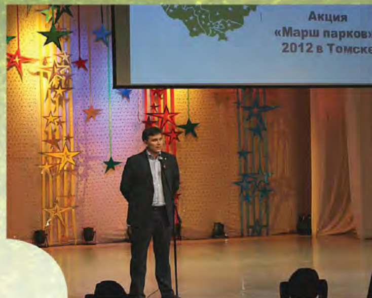
Акция «Марш парков» 2012 в Томске

последующие годы. Мы будем рассматривать возможность для сотрудничества с партнерами,