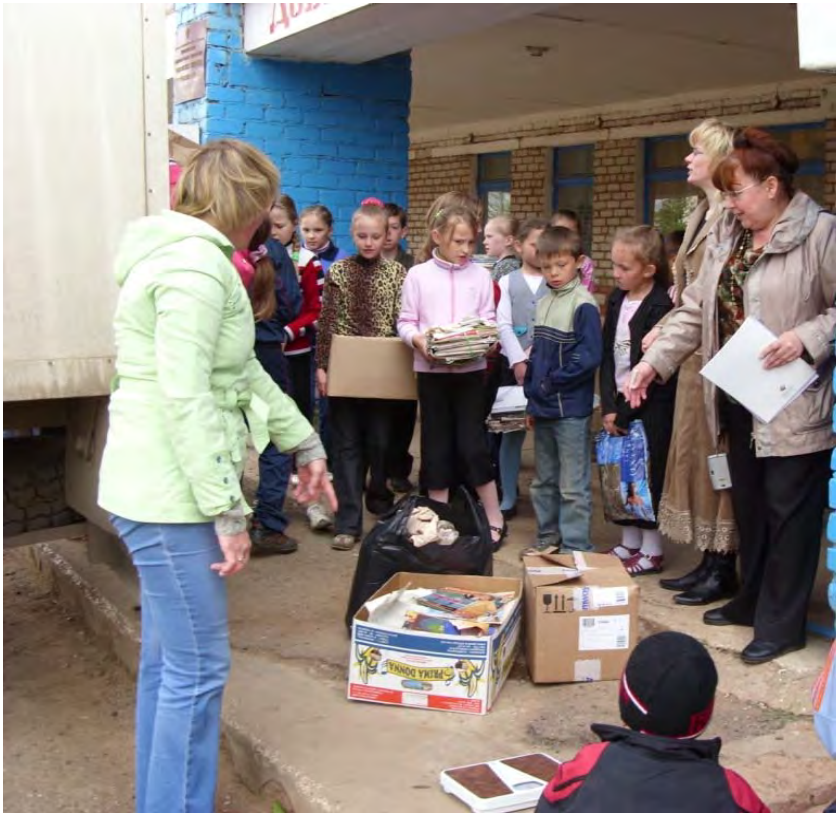
Акция «Зеленый weekend»