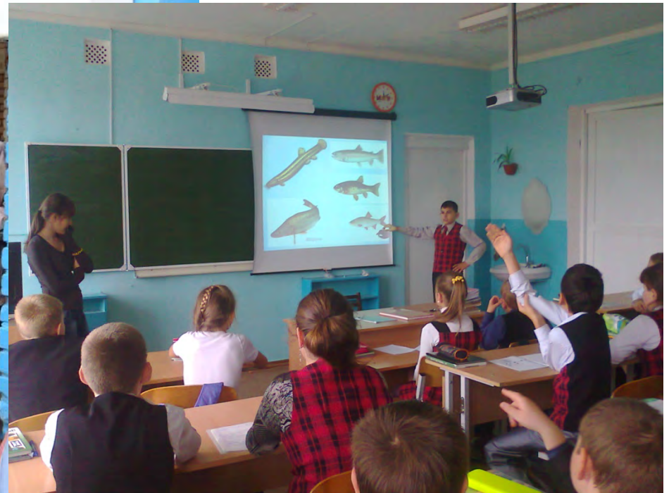
Беседа о прудах