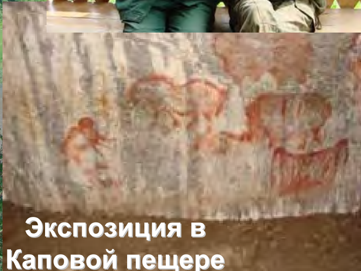
Экспозиция в Каповой пещере