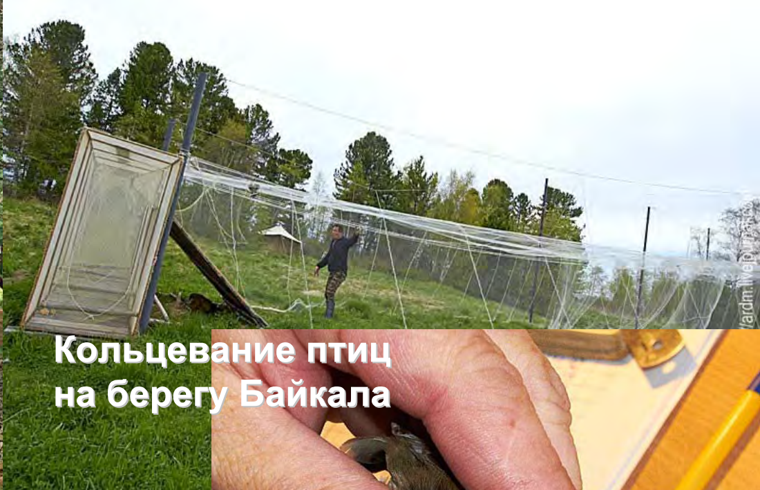
Кольцевание птиц на берегу Байкала