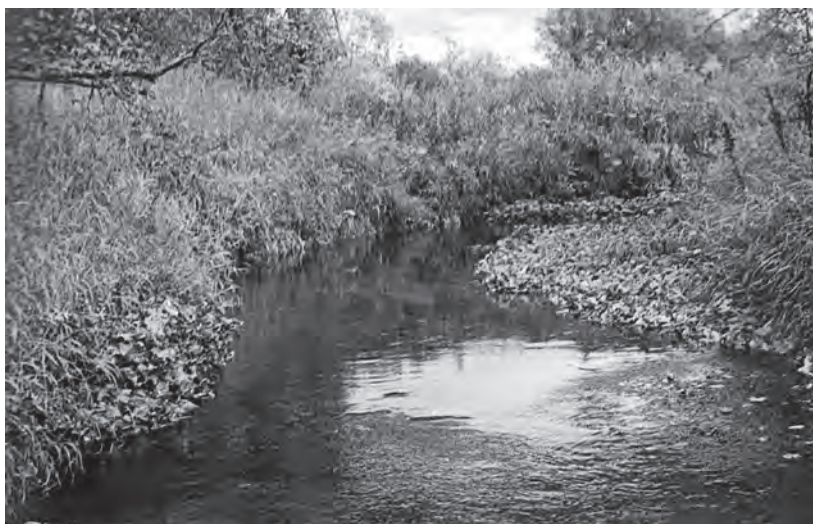
Нерестовый рыбный ключ по р. Быстрой