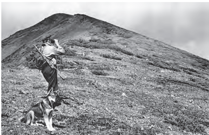
Гора Вахтан. Предгольцовая зона. Видны карликовые кедровнички

Гольцы. Выше пояса горных тундр и до вечных снегов и льдов располагаются каменистые россыпи, скальные участки и горные вершины, почти лишённые растительности. Между камнями здесь ютятся крошечные полярные ивки, камнеломки, астргалы, лишайники и мхи, которые, по-видимому, ещё служат