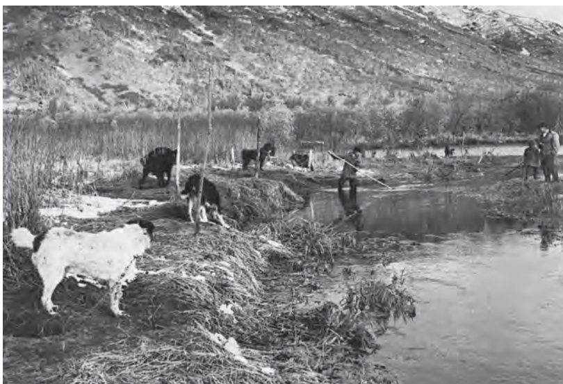
Ездовые собаки перед кормлением. Рыба сохраняется в ключе. Село Малки