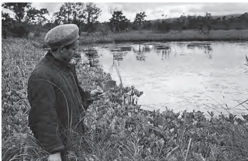
Одно из старичных Налычевских озёр. Заросли вахты трёхлистной. Сентябрь 1962 г.