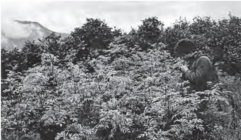
Учёт урожая ягод рябинового стланца

Площадь кедровников, к сожалению, за последние годы уменьшается ускоренным темпом из-за пожаров и вырубок на дрова. Особенно большой урон наносят пожары, без которых юго-восток Камчатки не обошелся ни один год. В 1962 г., например, горели кедрачи у подножья Авачинского вулкана.