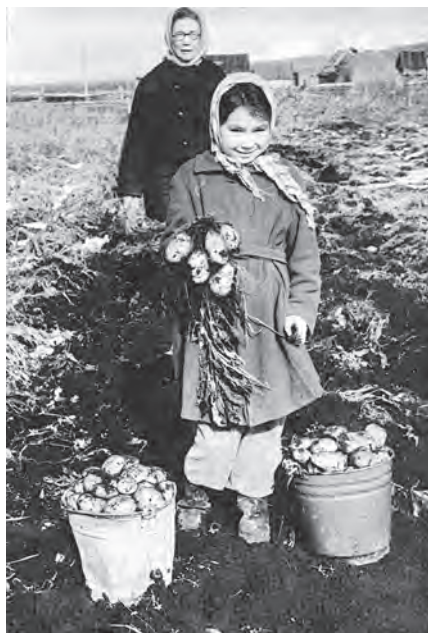
Картофель, выращенный около с. Малки; урожайность — до 350 ц/га