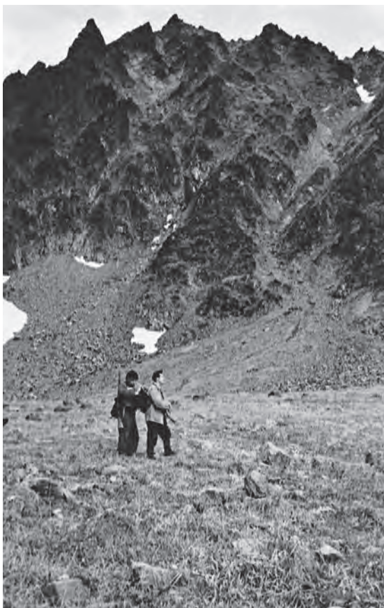
Вершина цирка Ганальского Вахтана. Сентябрь 1962 г.

Основной Восточно-Камчатский хребет (Ганальские востряки, Валагинские горы) имеет ярко выраженный альпийский характер с резкими формами рельефа, свежими карами, зачастую заполненными фирновым снегом. Некоторое представление об этих диких и красивых местах дают прилагаемые фотографии.