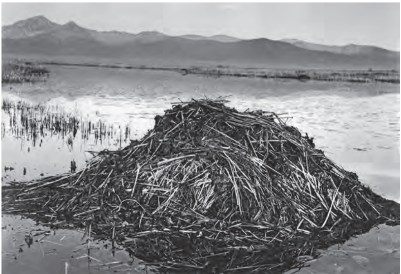
Хламовитское озеро. Хатки ондатры

Причём отдушин довольно много. Это говорит о том, что полоса кормового участка по сплаvine в безморозный период