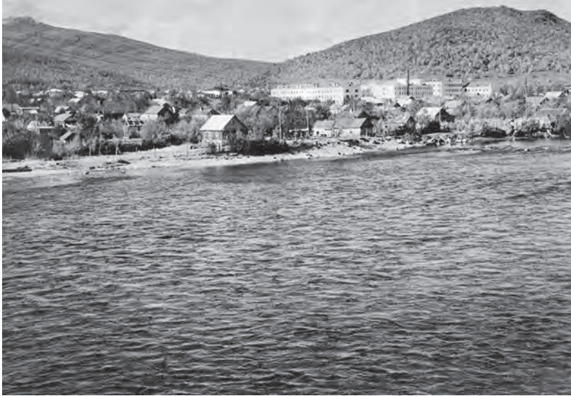
Вид на село Елизово с р. Авачи