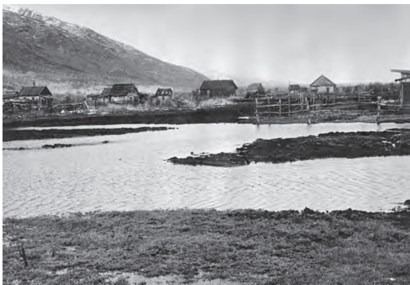
Село Малки после дождя