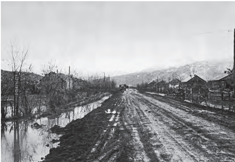
Посёлок Дальний после дождя