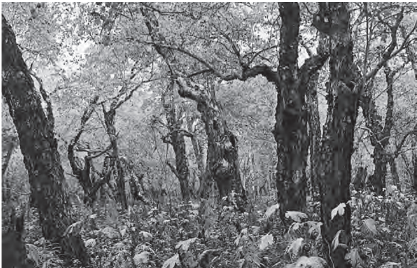
Участки вековых каменноберезников в долине р. Быстрой. Видны многочисленные дупла

Каменноберезники кустарничковые, наоборот, имеют очень густой подлесок из стланиковой рябины бузинолистной с крупными