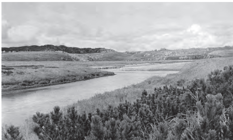
Река Кронуцкая в нижнем течении. Места зимовок водоплавающих птиц

Основной паводок наблюдается в конце мая и продолжается до середины июля, что связано с интенсивным таянием снега в горах. В низовьях крупных рек уровень воды повышается