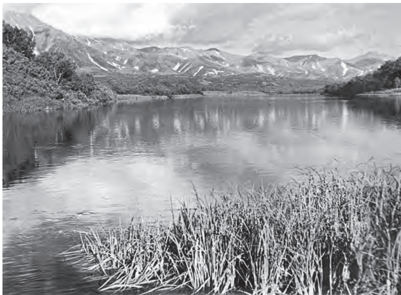
Река Плотникова вблизи истока из оз. Начикинского, место выпуска ондатры в ноябре 1962 г.