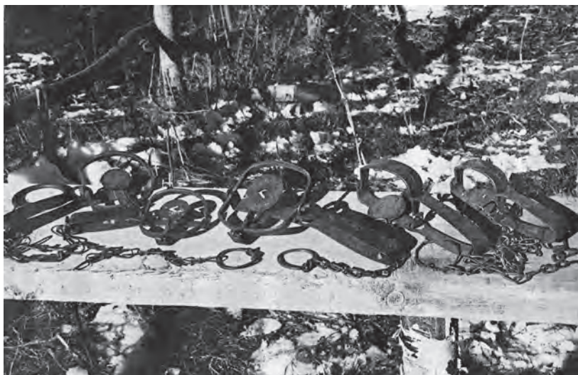
Капканы различных систем и номеров — основное орудие лова охотников

Предпочитают «переножить» охотники Жупановского «куста», промышленяющие в основном в равнинных угодьях. Охотники, промышленяющие по р. Аваче, где соболей стало крайне мало, и в других местах, а также некоторые «переножники», чтобы не выглядеть только соболятниками, ставят капканы на лисиц.