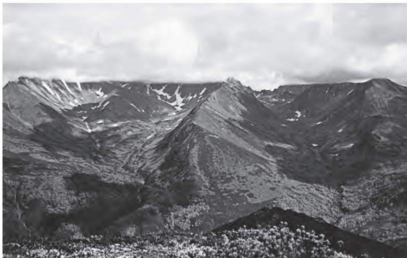
Горные цирки со снежниками — типичные летние места обитания снежных баранов

Участок хр. Срединного (Малкинские горы, входящие в его состав) также имеет характер альпийской складчатости, но с несравненно более спокойными и сглаженными формами.