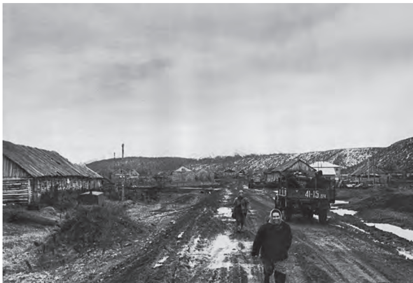
Посёлок Дальний — центральная усадьба Начикинского совхоза