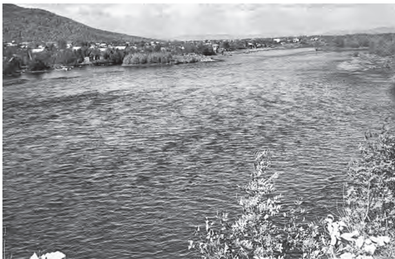
Река Авача в районе с. Елизова

Достаточно батов имеется на крупной р. Быстрой, но это, пожалуй, самая бедная водоплавающей дичью река. За 30 км сплава по ней можно взять не более 5–6 уток. Даже на р. Аваче, в условиях большой плотности населения, дичи больше раза в два.