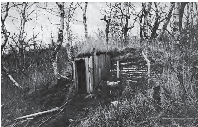
Охотничья землянка южнее с. Жупаново

Промыслом по р. Жупанова освоено до 800 км 2 , из которых свыше 200 км 2 падает на приморские озёра и болота. Остаётся только гадать, каковы запасы соболей на остальных более чем 4500 км 2 бассейна реки. Никаких учётных материалов и даже опросных сведений по этой территории собрать в районе не удалось. Лишь из опросов мильковских охотников в 1954 г.