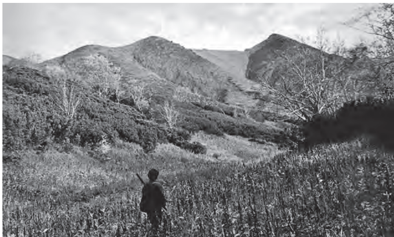
Зона кустарников и альпийских лугов

Поскольку значительная часть лугов расположена (и учтена) в лесной зоне, мы должны учитывать их как составную произво-