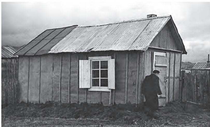
Заготпункт рыбокооп. Тралфлота на 8 км Елизовского шоссе