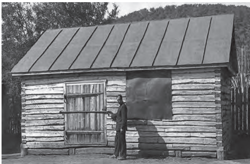
Пункт приема пушнины Пригородного рыбокооп

Экспедиция намечает пока постройку трёх охотничьих баз, по одной на каждом производственном участке. В процессе