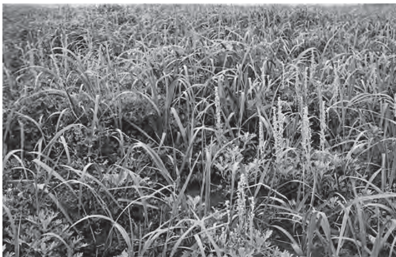
Растительность морских кос в районе р. Налычева

Озёра и лиманы. Ресурсы растительности в озёрах и лиманах обычно незначительны. На хорошо прогреваемых местах обильные заросли образуют только рдесты и кубышки. Ресурсы растительности озёр более подробно рассматриваются нами в характеристике ондатровых угодий. Озёра и лиманы района чрезвычайно богаты водоплавающей дичью и рыбой, которые