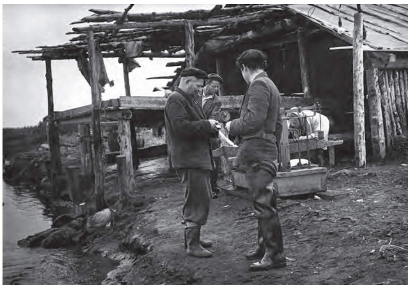
Налычевская рыбалка. Засольный цех