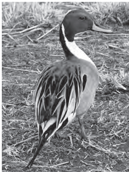
Шилохвость — один из самых массовых видов речных уток юго-востока Камчатки

Число зимующих лебедей достигает в районе, по-видимому, не менее 500 голов. Только по р. Тихой и оз. Начикинскому в зиму 1961/62 г. нами было отмечено около 130 шт. Есть лебеди на реках Быстрой, Аваче, Жупанова и в других местах.