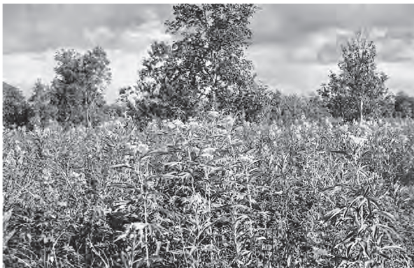
Шеламайник по белоберёзовому «аласу» вблизи с. Коряки

Значение белоберезниковых лесов как соболиных угодий будет постепенно уменьшаться, так как большая их часть находится в полосе госземфонда. Уже сейчас на значительных площадях здесь ведутся кормозаготовки и пастьба скота. Со специализацией Начикинского совхоза на животноводстве и передачей ему скота из других совхозов резко увеличится выпас скота в районе Малки — Ганалы. Однако о существенном